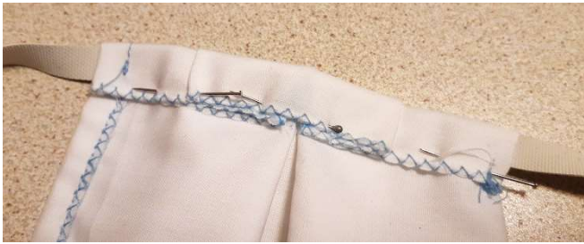
Replier et piquer sur le zig-zag