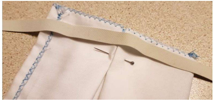
Positionner un élastique de chaque côté