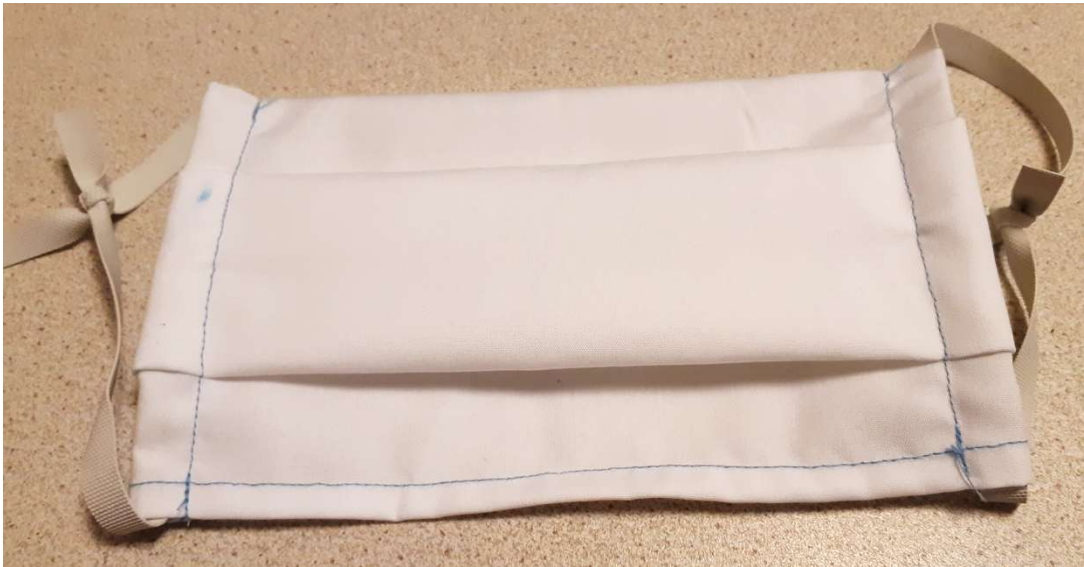
Faire un nœud avec les élastiques, selon la longueur souhaitée, et voilà c'est fini, reste à laver et repasser