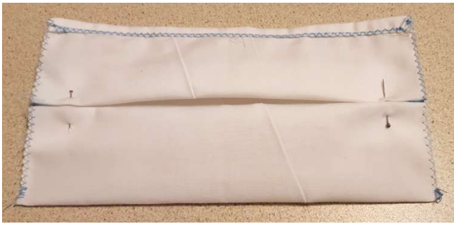
Maintenir avec des épingles